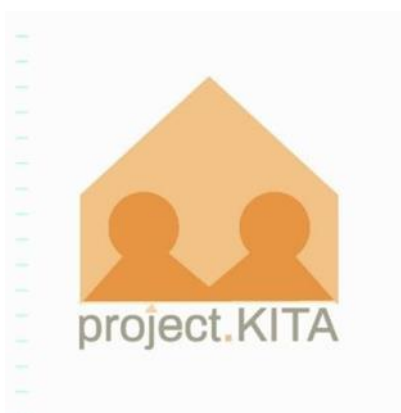
Gambar 3. Elemen kolaborasi logo studio project.KITA

Elemen kedua yaitu elemen 'kolaborasi' atau kerja sama dari kata 'KITA' Yang dipresentasikan dengan bentuk dua orang yang saling berdekatan. Ini mengartikan tujuan dan cara kerja dari studio ini yang menekankan dan memfokuskan agar proyek yang dikerjakan merupakan tanggung jawab bersama dalam mencapai tujuan yang ingin dicapai dengan komunikasi, motivasi, transparansi dan rasa saling percaya agar terbentuk sebuah kualitas yang baik dalam hubungan kerja sama (Setiyanti, 2012) Yaitu antara penyedia jasa desain dan klien, atau dengan mitra kerja sama yang lain.