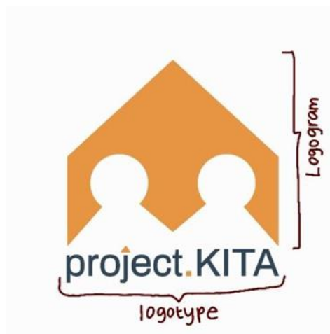
Gambar 1. Logo studio project.KITA

Simbol utama pada logo studio project.KITA yaitu simbol bangunan dengan atap segitiga yang merupakan ciri atau karakteristik yang sering dan paling menonjol dari desain bangunan tropis, dan jenis bangunan dengan atap ini yang paling banyak digunakan di Indonesia (Kusumowardani, 2021). Dengan menggunakan simbol bangunan dengan atap segitiga, tujuan agar bentuk bangunan yang menjadi simbol utama ini akan dapat lebih mudah dikenali dan dipahami juga tidak sulit bagi konsumen atau audien dalam mencerna maksud secara garis besar dari logo tersebut.