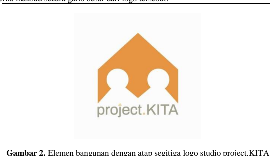
Gambar 2. Elemen bangunan dengan atap segitiga logo studio project.KITA

Simbol utama pada logo studio project.KITA yaitu simbol bangunan dengan atap segitiga yang merupakan ciri atau karakteristik yang sering dan paling menonjol dari desain bangunan tropis, dan jenis bangunan dengan atap ini yang paling banyak digunakan di Indonesia (Kusumowardani, 2021). Dengan menggunakan simbol bangunan dengan atap segitiga, tujuan agar bentuk bangunan yang menjadi simbol utama ini akan dapat lebih mudah dikenali dan dipahami juga tidak sulit bagi konsumen atau audien dalam mencerna maksud secara garis besar dari logo tersebut.