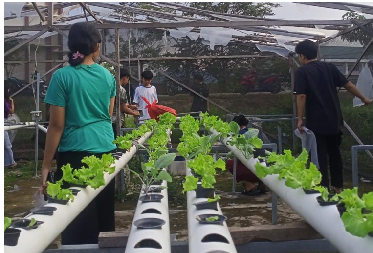
Gambar 1. 2. Jenis sayuran yang tanam

Jawaban: Jenis benih atau bibit yang sering di tanam di kebun Hidroponik yaitu Selada, Bayam, Pakcoy, Sawi hijau, kailan dan kangkung.