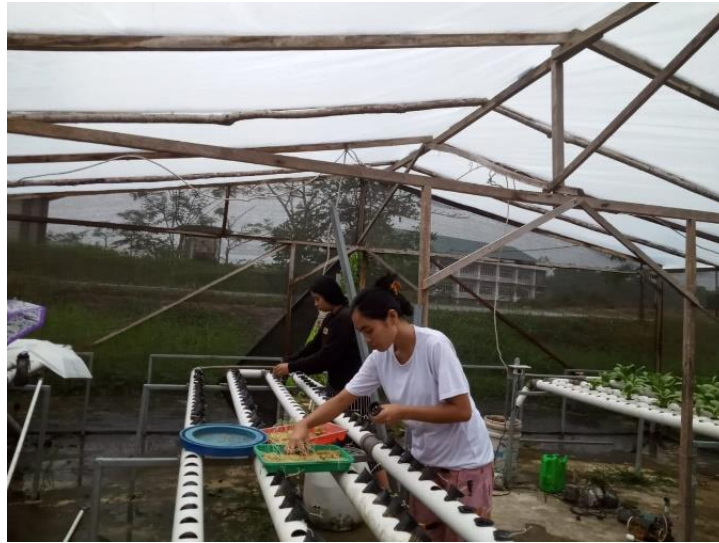
Gambar 1.1. Proses penanaman