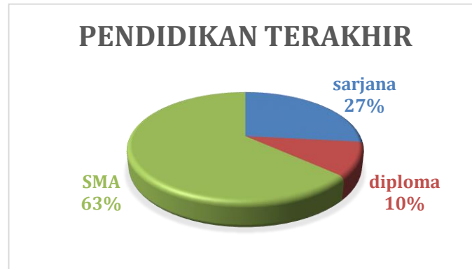
Gambar. 2 Jenis Usaha Pelaku UMKM

Berikut adalah data grafik Pendidikan terakhir pelaku UKMK menurut Sample yang di teliti