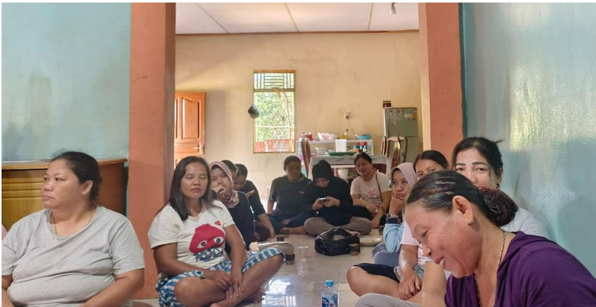
Gambar 2 Peserta Kegiatan Pengabdian Kepada Masyarakat Tomat Intan

Program pengabdian kepada masyarakat dalam upaya meningkatkan kerja sama tim dilakukan di wilayah Kecamatan Bengkayang kepada KWT Tomat Intan. Kegiatan ini dimaksudkan untuk memberikan pendampingan kepada KWT dalam penguatan kelompok wanita tani. Kerja sama dalam kelompok sangat penting dalam meningkatkan kinerja tim (Sundari and Wijayanto, 2024). Kinerja tim yang baik akan mampu mendorong produktivitas tim dalam menghasilkan produk dalam hal ini sayuran yang dapat membantu para ibu-ibu dalam penguatan ketahanan pangan keluarga. Peserta yang hadir dalam kegiatan ini berjumlah 25 orang yang terdiri dari ibu-ibu anggota KWT Tomat Intan. Kegiatan dilaksanakan pada salah satu rumah warga anggota KWT. Para peserta terlihat cukup antusias dalam mengikuti proses kegiatan pengabdian ini. Beberapa diantara mereka aktif bertanya dan menjawab pertanyaan yang dilontarkan oleh pemateri. Beberapa orang peserta dapat memberikan pendapat dan mampu menggambarkan kerja tim pada KWT Tomat Intan. Berikut gambar para peserta selama pemberian materi dan diskusi.