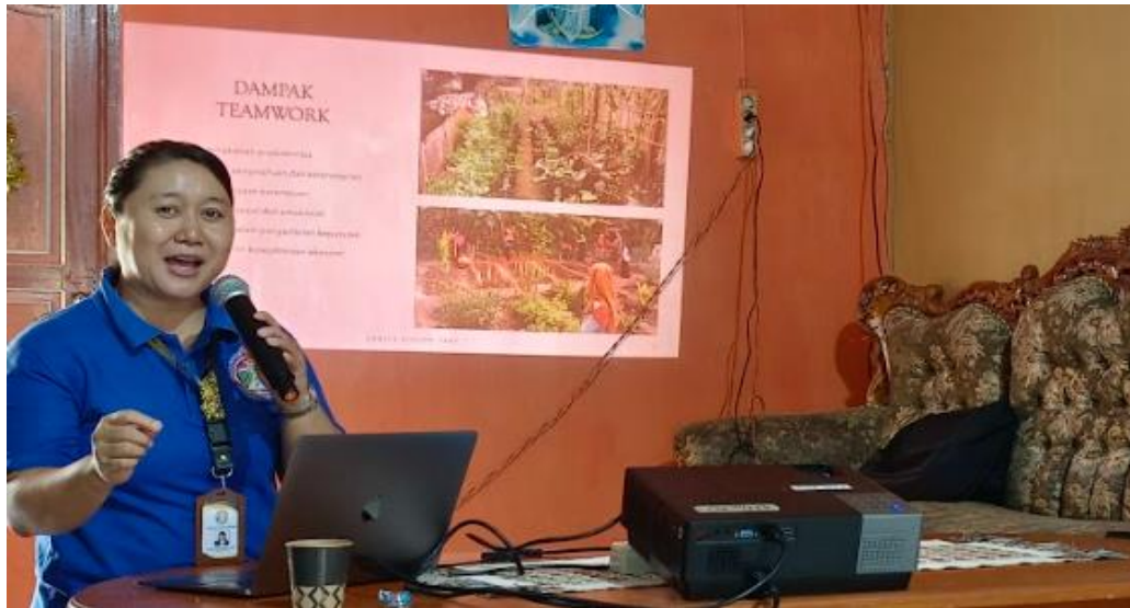
Gambar 1 Pemberian Materi Mengenai Teamwork

banyak peserta sekaligus dan lebih efisien. Melalui metode ceramah maka peserta mampu memahami dengan lebih baik tujuan dan manfaat Kerja sama di dalam tim khususnya dalam pengelolaan kebun kelompok.