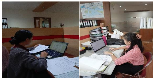
Gambar 1. Dokumentasi Kegiatan Magang