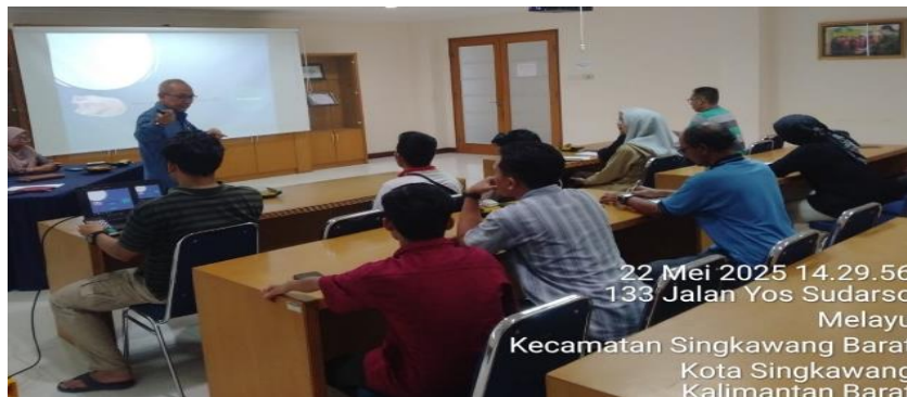
Gambar 1. Dokumentasi Kegiatan Magang

Higiene adalah bentuk dimana untuk menjaga kebersihan dan kesehatan, baik diri sendiri maupun di lingkungan, dengan tujuan memberikan kesehatan agar terhindar dari penyakit serta memberikan kesejahteraan. Hygiene menurut Kementerian Kesehatan Republik Indonesia dalam dalam penelitian Sundoro, (2025) yang berjudul Personal Hygiene Wajah Dan Keparahan Acne Vulgaris Pada Remaja adalah suatu tindakan untuk menjaga kebersihan diri, seperti mencuci tangan dengan air bersih dan sabun, menjaga kebersihan piring, dan membuang makanan yang tidak layak untuk menjaga makanan secara kebersihan 10 . Personal Dalam kegiatan ini mahasiswa terlibat dalam mengikuti pelatihan higiene yang diberikan oleh perusahaan sebagai bagian dari standar operasional di lingkungan kerja, khususnya dalam industri agribisnis. Pelatihan ini bertujuan agar mahasiswa memahami pentingnya kebersihan pribadi dan lingkungan kerja guna menjamin kualitas dan keamanan produk.