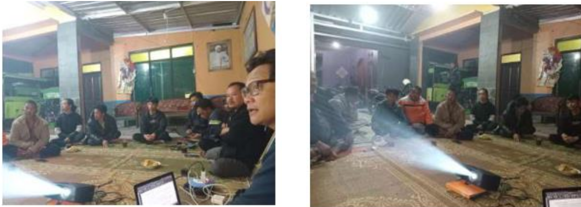
Gambar 3. Suasana pendampingan penyusunan proposal pendanaan

Secara keseluruhan, proses pendampingan penyusunan proposal ini berhasil mencapai tujuan yang ditetapkan. Peserta tidak hanya memperoleh pengetahuan dan keterampilan baru, tetapi juga merasa lebih percaya diri dalam menyusun proposal pendanaan. Rekomendasi untuk kegiatan selanjutnya adalah melakukan pendampingan lanjutan untuk membantu peserta dalam proses pengajuan dan implementasi program, serta membangun jaringan antar organisasi kebudayaan untuk saling mendukung dalam upaya penggalangan dana. Dengan demikian, diharapkan keberlanjutan program-program kebudayaan dapat terjaga dan semakin berkembang.