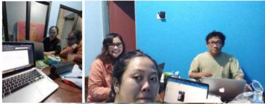
Gambar 2. Suasana penyusunan materi pendampingan

Sesi mengenai penyusunan anggaran juga memberikan dampak positif. Peserta belajar untuk mengidentifikasi semua sumber daya yang diperlukan dan menyusun anggaran yang transparan. Beberapa peserta mengungkapkan bahwa mereka sebelumnya kesulitan dalam merencanakan anggaran, tetapi setelah bimbingan, mereka mampu menyusun anggaran yang lebih realistis dan sesuai dengan kebutuhan program. Hal ini menunjukkan bahwa pendampingan berhasil meningkatkan kemampuan manajerial peserta.