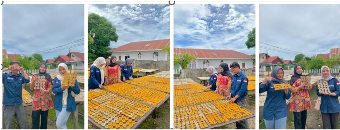
Gambar 2: Dokumentasi Pelaksanaan

Dengan adanya pelatihan dan pendampingan ini, UMKM kerupuk tidak hanya mendapatkan keterampilan baru, tetapi juga didorong untuk mengubah kebiasaan mereka dalam mengelola keuangan. Pembukuan sederhana membantu mereka untuk lebih transparan dan terorganisasi dalam menjalankan usaha. Ke depan, pendekatan ini dapat diperluas untuk menjangkau lebih banyak UMKM di sektor lain yang menghadapi tantangan serupa. Hal ini membuktikan bahwa pembukuan sederhana bukan hanya teori, tetapi solusi praktis yang dapat diterapkan oleh pelaku usaha kecil untuk meningkatkan efisiensi dan keberlanjutan usaha mereka.