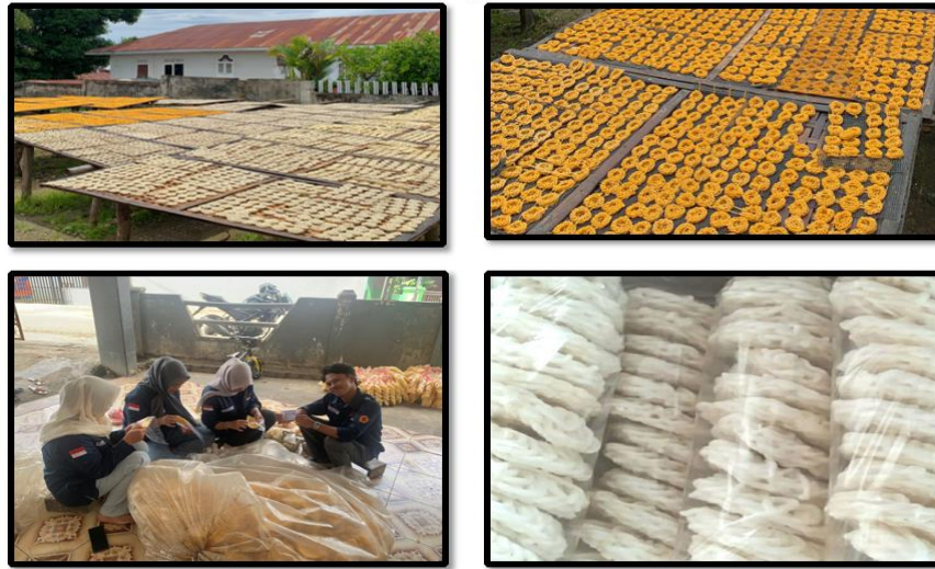
Gambar 1 : Proses penjemuran dan pengemasan produk

Namun, dalam menjalankan usaha, ini, banyak tantangan, yang harus dihadapi. Salah satunya adalah, pelatihan dan pendampingan yang belum optimal. Pelatihan dan pendampingan yang baik, adalah kunci utama dalam menjalankan usaha. Pelatihan dan pendampingan meliputi berbagai aspek, seperti penyampaian materi, praktik, tanya jawab, dan diskusi. Dengan manajemen usaha yang baik, usaha, dapat berjalan dengan lancar, dan dapat mencapai tujuan, yang telah ditetapkan.