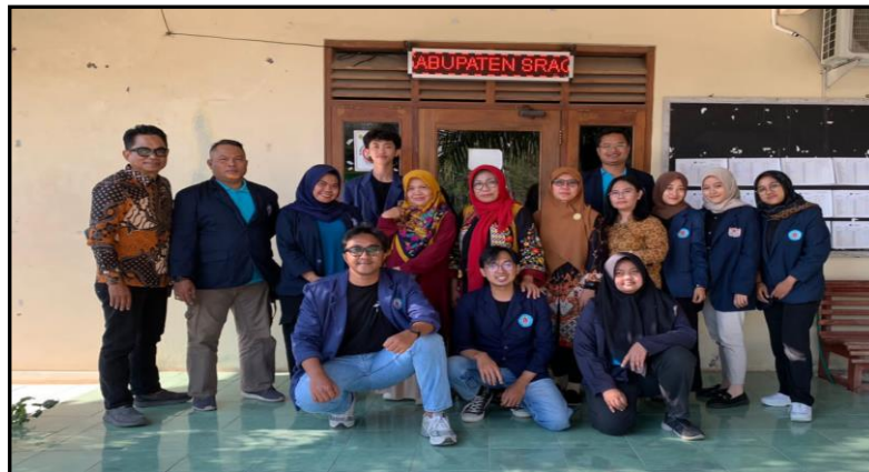
Gambar 2. Surveyor awal di lokasi pengabdian kepada masyarakat