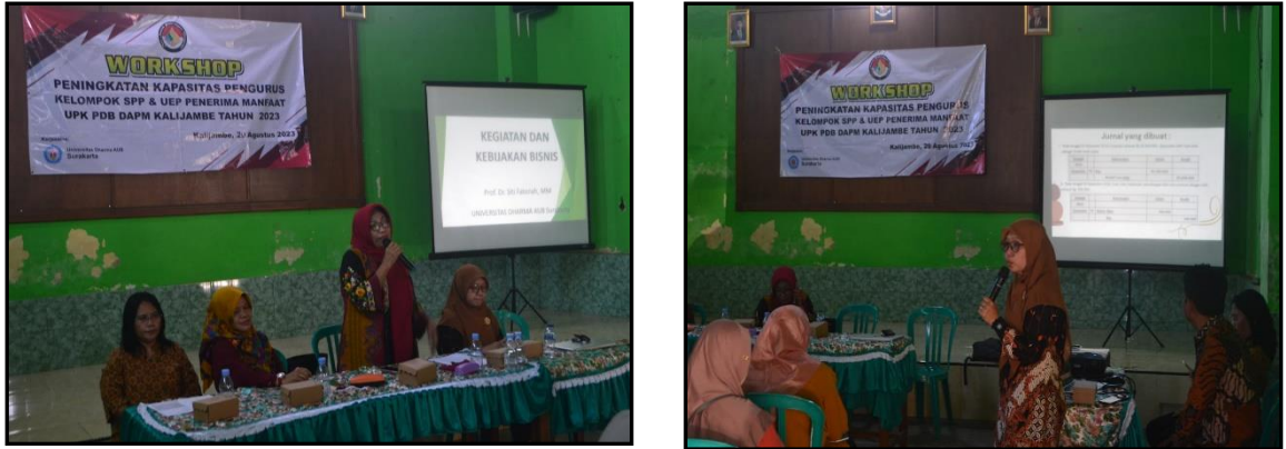
Gambar 3. Edukasi dan Pemberian Materi oleh Tim Pengabdian kepada Masyarakat