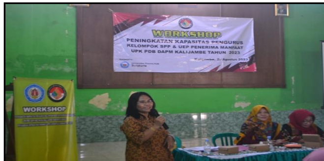
Gambar 4. Pendampingan dan Tanya jawab