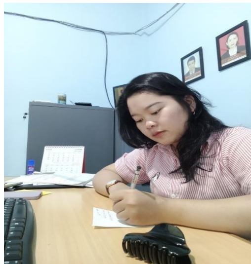
Gambar 3 Saat membantu menjaga kasir.