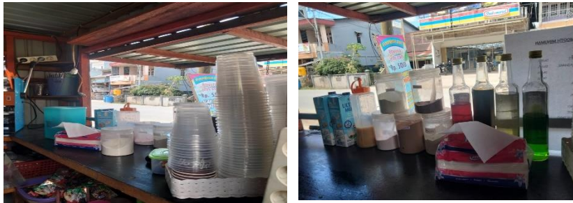
Gambar 1. Penerapan Modul 5S