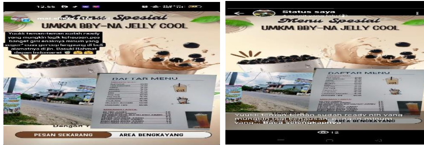
Gambar 2. Penerapan Modul 5S