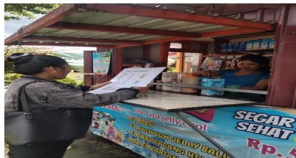
Gambar 3. Dokumentasi dengan konsumen