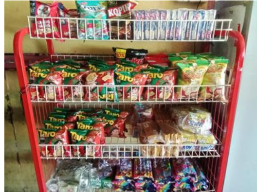
Gambar 5. Penerapan Modul 5S