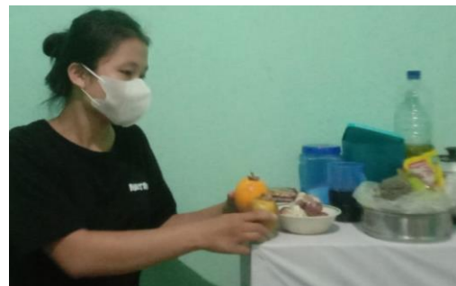
Gambar 7. Proses Kegiatan Penerapan Modul K3 Di Dapur