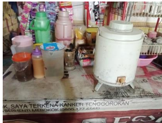
Gambar 3. Penerapan Modul 5S