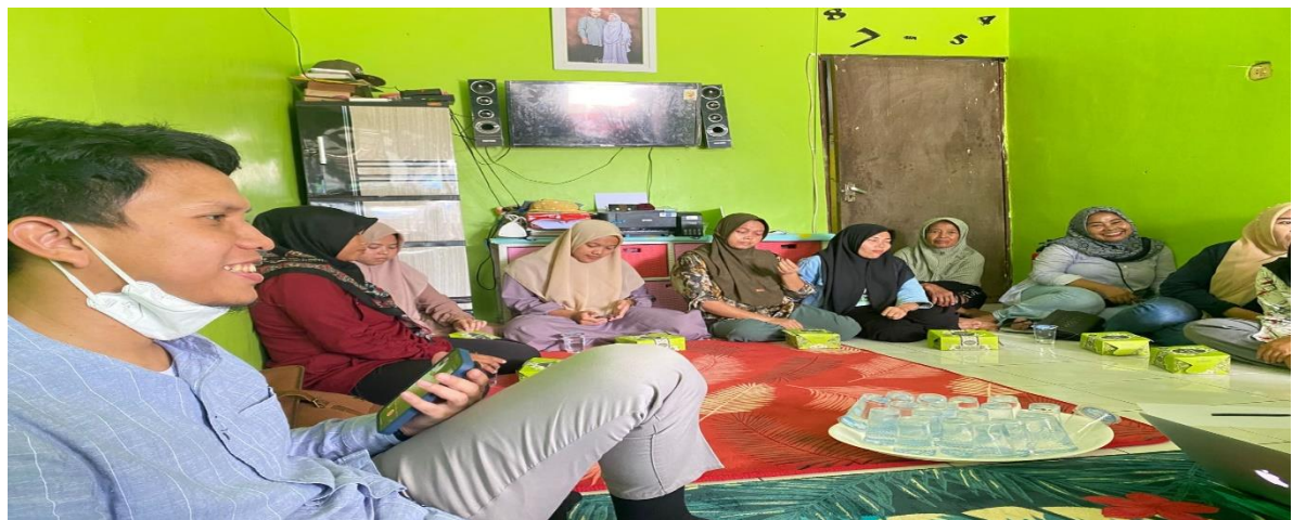
Gambar 2. Diskusi para peserta dan Pengabdian