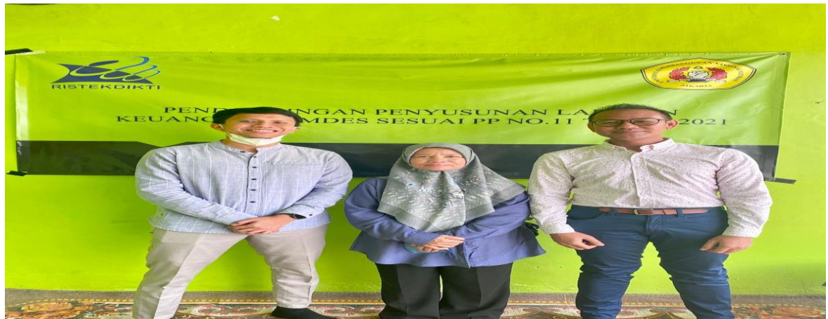
Gambar 3. Tim Pengabdian

Para peserta yang diundang dalam mengikuti program pemahaman dan pelatihan ini sangat antusias dan semangat, hal ini dapat dilihat dengan ketepatan waktu pelaksanaan yang dibuat dan mereka tepat waktu datangnya beserta respon terkait dengan para pemateri sangat baik hal ini karena mereka cukup antusias. Disamping itu juga, jumlah pengurus dan anggota BUMDes yang hadir sesuai dengan yang diharapkan oleh para pengabdian dan hal ini juga para pengabdian berpeseran untuk menyampaikan pengetahuan ini kepada para pengurus BUMDes lain yang tidak bisa hadir dalam mengikuti workshop yang dilakukan oleh para pengabdian.