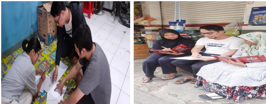
Gambar 1. Dokumentasi kegiatan

Pelaksanaan kegiatan pengabdian telah berjalan dengan baik dan lancar. Peserta yang dapat mengikuti kegiatan pengabdian ini berjumlah lima orang dari sembilan yang direncanakan. Empat peserta yang tidak dapat hadir karena kesibukan dalam mengurus usaha dan rumah tangga dan lokasinya jauh. Peserta pelatihan yang merupakan Penjual Sembako di Jalan Kampung Sawah Tangerang Selatan sangat antusias dan fokus menyimak penjelasan dari nara sumber. Selain itu, untuk mengetahui apakah hasilnya atau kegiatan pelatihan sudah terlaksana dengan efektif atau telah sesuai dengan tujuan yang diharapkan dan ditetapkan maka, perlu dilakukan evaluasi. Kegiatan pengabdian ini dievaluasi melalui kuesioner untuk mengetahui pengetahuan dan pemahaman tentang Akuntansi dan manfaat penyusunan laporan keuangan UMKM. Kuesioner diberikan kepada peserta saat sebelum kegiatan tahap awal atau sebelum penyuluhan. Kemudian, sesudah kegiatan atau setelah pelaksanaan tahap kedua/tutorial, diberikan post test yang berisi pernyataan yang sama (sebelum dan sesudah kegiatan). Melalui kegiatan pelatihan penyusunan laporan keuangan, tingkat keberhasilan kegiatan pengabdian ini juga dapat diketahui dari latihann yang diberikan. Selain itu, dari hasil diskusi kelompok dan pertanyaan-pertanyaan yang diajukan oleh para peserta, akan diketahui kemauan atau keinginan menggunakan Akuntansi untuk meningkatkan kinerja keuangan dan usaha mereka (Farida et al., 2022). Berikut ini disajikan tabel evaluasi program pengabdian ini.