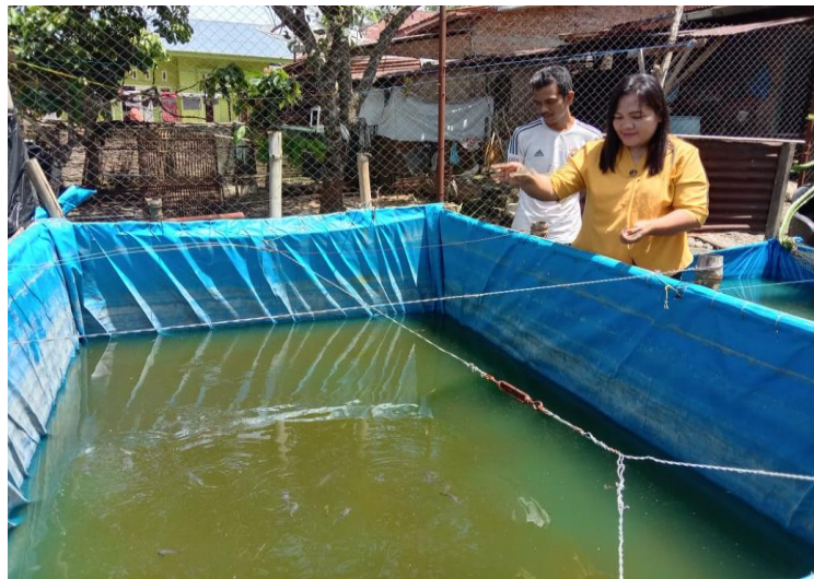
Gambar 4. Pemberian larva BSF (magot) sebagai pakan ikan lele

Maggot yang merupakan larva lalat Black Soldier Fly (BSF) memang sangat istimewa dibandingkan bahan baku pakan alternatif lainnya karena mengandung nutrisi yang lengkap untuk pakan ternak dan kualitas yang baik. Maggot mengandung protein yang tinggi. Selain itu, Maggot bisa diproduksi dalam waktu singkat dan berkesinambungan dengan jumlah yang cukup untuk memenuhi kebutuhan pakan. Keunggulan lainnya, yaitu masyarakat mudah mengadopsi teknologi produksi Maggot. Kemudian, dalam prosesnya Maggot juga bisa