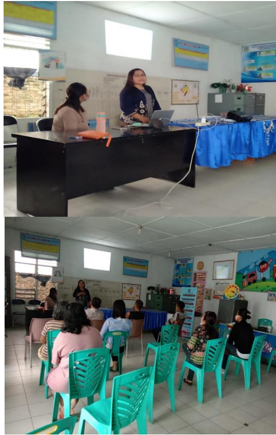
Gambar 2. Kegiatan Sosialisasi di Kelurahan Pardamean. Kecamatan Siantar Marihat.