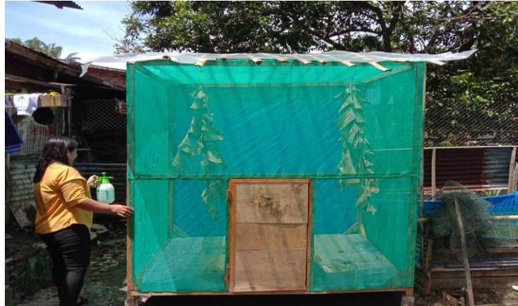
Gambar 3. Kandang budidaya Lalat BSF