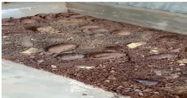
Gambar 4. Bioreaktor Tempat larva memproses limbah organik)