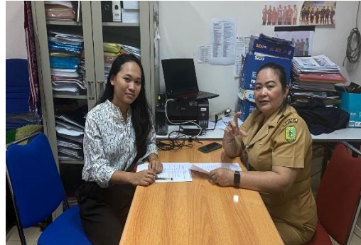
pendampingan pengelolaan media sosial