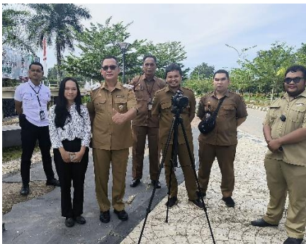
Peliputan media bersama pak Bupati