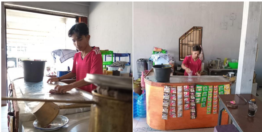
Gambar 3 Implementasi Modul K3 Hygiene

Permasalahan kedua adalah kebersihan dalam menyiapkan peralatan warkop diantaranya adalah gelas, piring, sendok yang telah digunakan tidak dicuci dengan bersih hanya di siram menggunakan air biasa tanpa mencucinya terlebih dahulu menggunakan sabun cuci dan juga area produksi kopi tidak dibersihkan setelah melaksanakan proses produksi. Tentunya ini sangat mengganggu dan akan mendapatkan kesan lisan yang negatif dari konsumen yang melihatnya, selain itu lantai area produksi selalu basah terkena percikan air cucian sehingga menyebabkan lantai menjadi licin dan tidak menutup kemungkinan bisa terjadi kecelakaan kerja seperti terpeleset. Modul yang sesuai dengan permasalahan terkait adalah modul K3 Hygiene, dalam menerapkan modul ini pelaksana mencuci semua peralatan yang ada di area produksi untuk menghilangkan kotoran-kotoran yang sudah lama menempel pada peralatan dan juga untuk menghindari debu pelaksana menyiapkan beberapa helai serbet untuk menutup peralatan yang terbuka supaya debu tidak menempel pada gelas, sendok, maupun piring. Lantai yang sering basah dieksekusi oleh pelaksana dengan menyediakan kain pel kering yang digunakan khusus untuk mengelap lantai basah. Implementasi modul K3 Hygiene sukses terlaksana dengan rutin dilaksanakan (Elisa & Nadapdap, 2023).