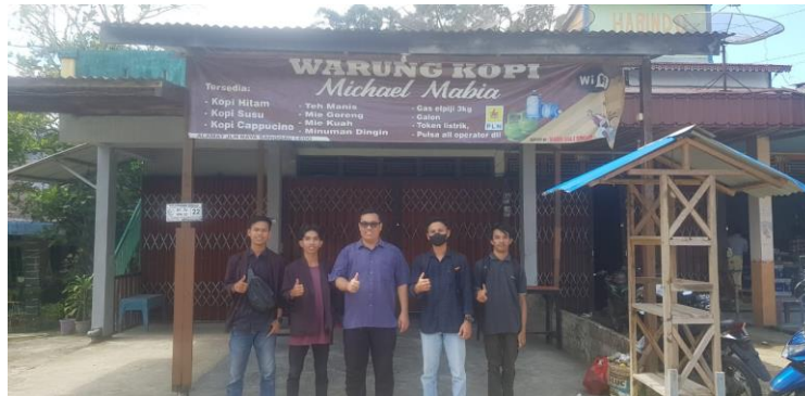
Gambar 1 Observasi Hari Pertama Bersama Dosen Pembimbing Lapangan dan Tim Pengabdian Masyarakat