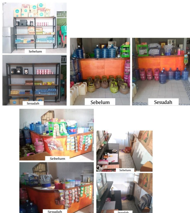
Gambar 2 Implementasi Modul 5S Layout

Dalam mengimplementasikan modul 5S ini berlangsung selama 3-4 hari dikarenakan kondisi warkop yang cukup memprihatinkan dari segi tataletak dan kebersihan lingkungan area warkop. Dengan terlaksananya modul 5S ini membuat area warkop dan tataletak barang menjadi lebih bersih dan rapi.