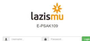
Gambar 2. Log in sistem SIM ZISKA

Selanjutnya, berikut ini adalah salah satu bentuk pengendalian internal untuk menjaga agar data tetap aman dan sesuai dengan apa yang telah dilakukan pengguna. Dalam satu user hanya dipegang oleh satu Amil saja sehingga masing-masing Amil hanya satu jenis umat saja. Misal, Amil A hanya memegang user untuk dana zakat saja, selanjutnya dana infaq akan dikerjakan oleh Amil B.