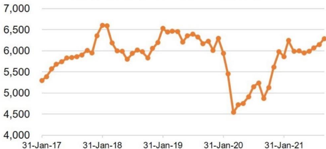
Gambar 1. Grafik pergerakan nilai IHSG tahun 2017 sampai dengan 2021.

Pergerakan nilai IHSG selama periode 2017 – 2021 tersaji dalam grafik diatas dan dapat dilihat bahwa beberapa tahun belakangan IHSG mengalami perubahan. Dalam penutupan perdagangan saham 29 desember 2017, IHSG ditutup pada level 6.355,65 atau menguat 19,99% dari tahun sebelumnya.